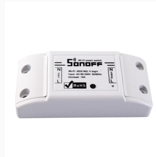
Sonoff WiFi prekidač