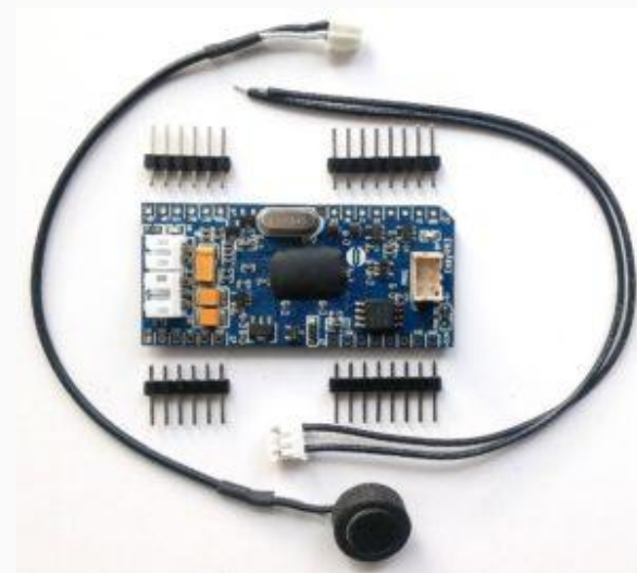
EasyVR 3.0 modul s mikrofonom